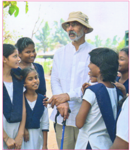
కర్ణజీవి - చిరునవ్వుల వెలుగులు - చిన్నారలు